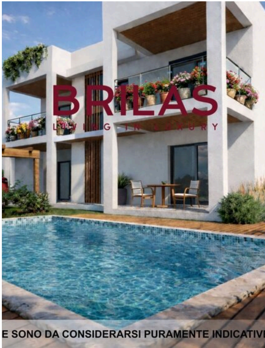
LE IMMAGINI PROPOSTE SONO DA CONSIDERARSI PURAMENTE INDICATIVE E NON VINCOLANTI