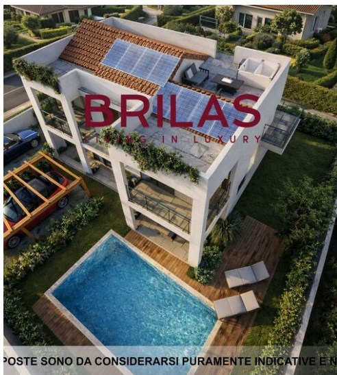
LE IMMAGINI PROPOSTE SONO DA CONSIDERARSI PURAMENTE INDICATIVE E NON VINCOLANTI