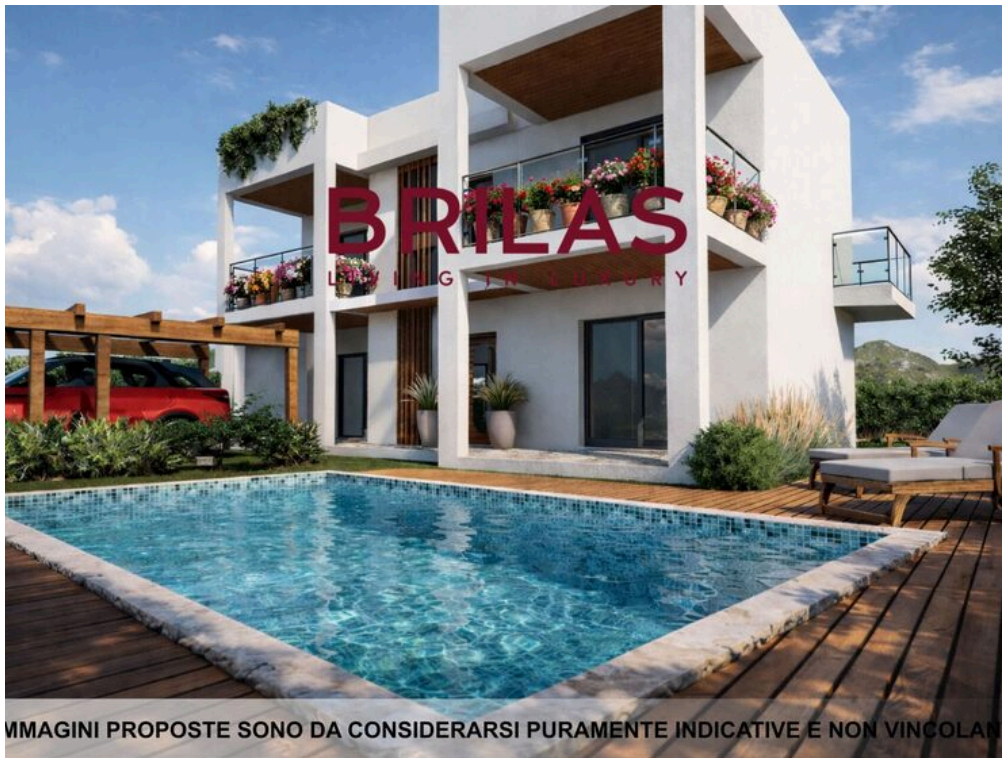
IMMAGINI PROPOSTE SONO DA CONSIDERARSI PURAMENTE INDICATIVE E NON VINCOLANTI